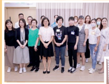
林校長與家教會 常務委員會座談會