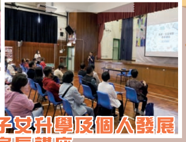
子女升學及個人發展 家長講座