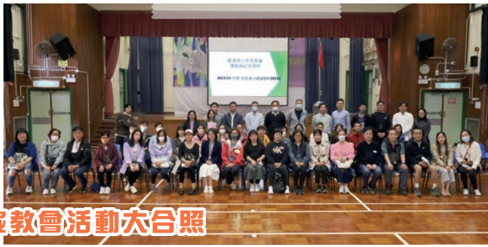
家教會活動大合照