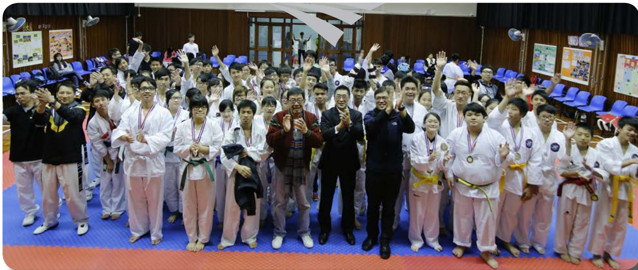
^ 2013- 2014 跆拳道友好邀請賽