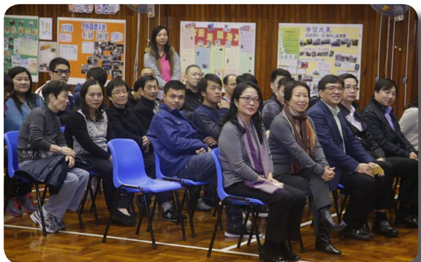
^ 第一屆校友會成立典禮