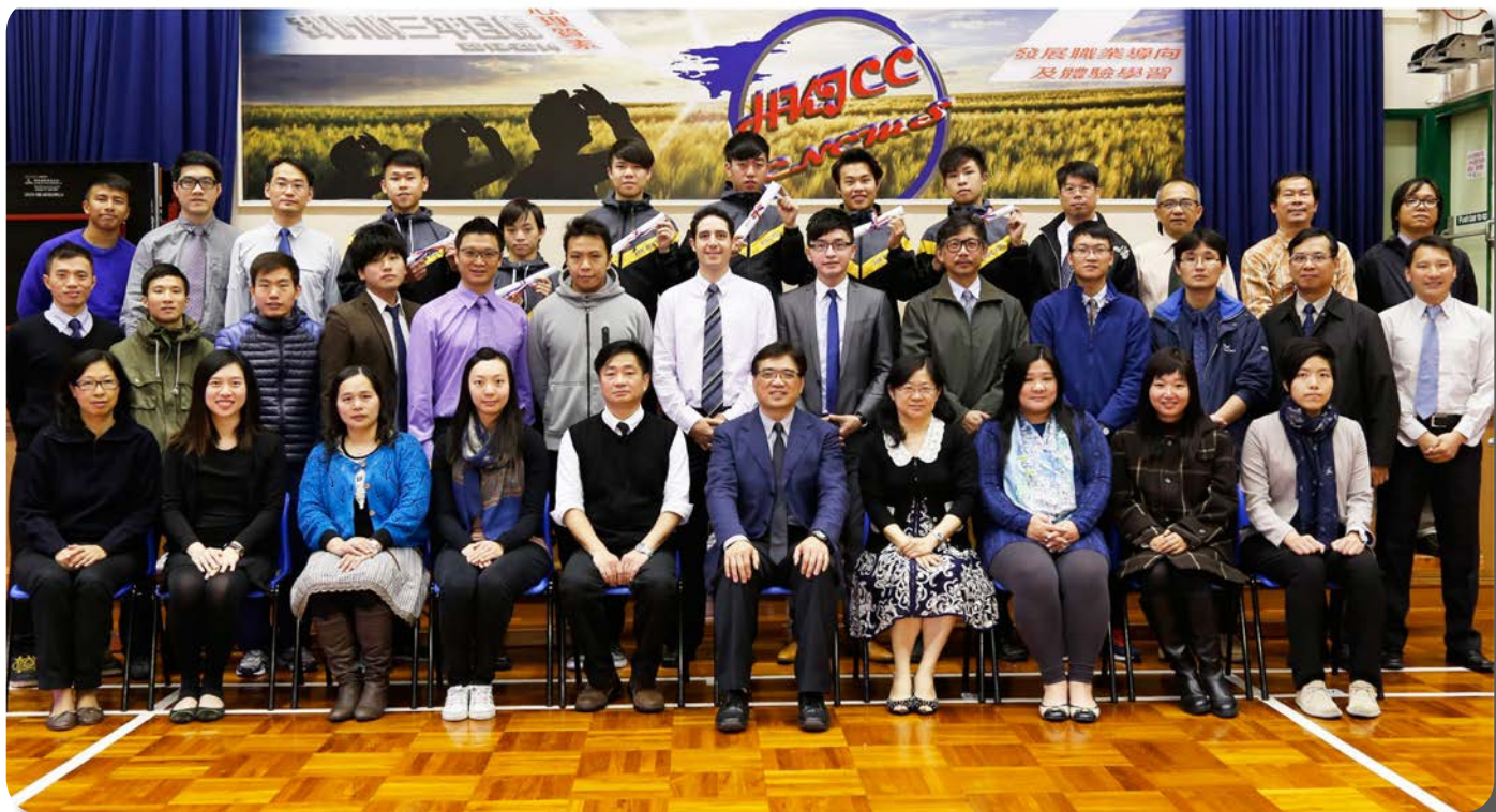
^ 2013-2014 年度中六畢業生及全體教職員