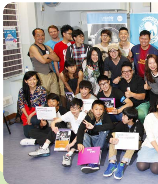
^ 聯合國兒童基金會短片