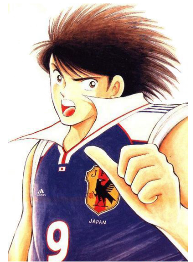
He doesn't fear playing against anyone.