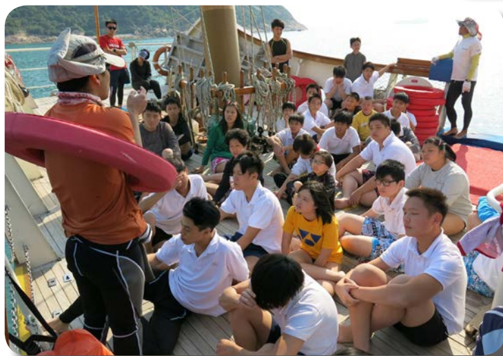
^ 同學們專心聆聽教練指示