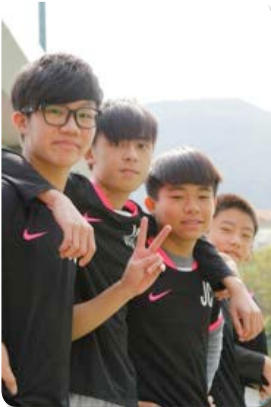
^ He always gets on well with teammates.