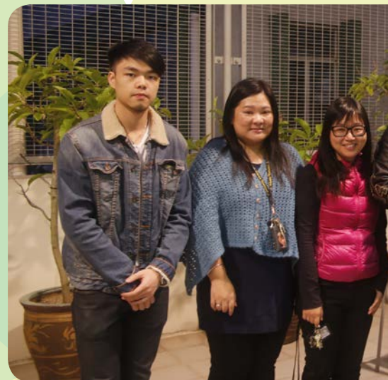
^ 我們的舊生與老師們亦師