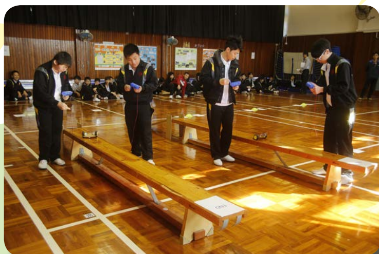
^ 校長盾：科學歷奇手動車比賽