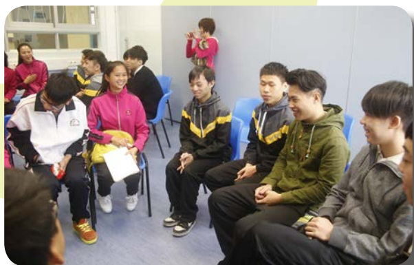
^粵港學生互相交流