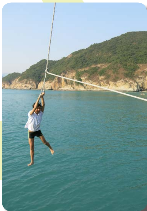
^ 勇敢地踏出第一跳