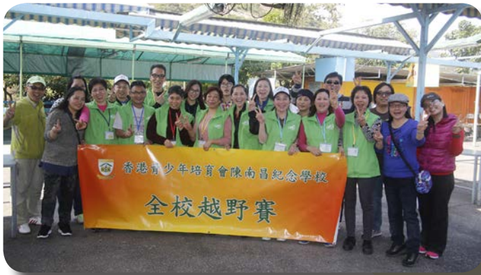
^ 週年越野賽家教會大合照