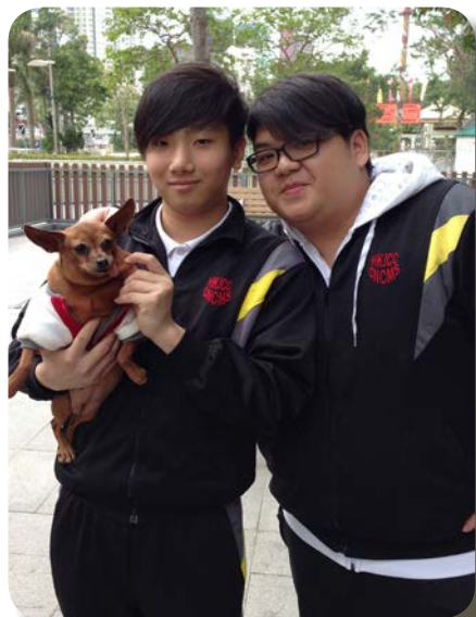
^ Dog Walking