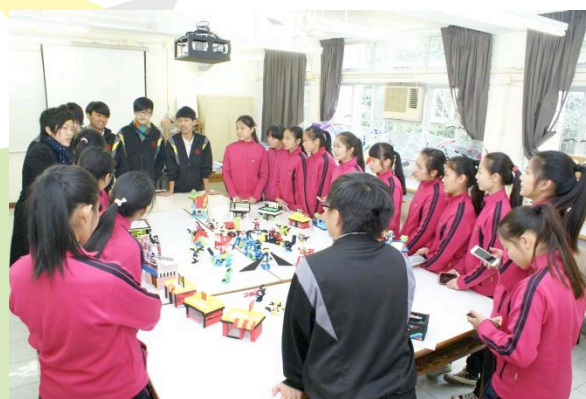
互相交流美設心得