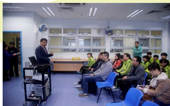
校長分享本校理念