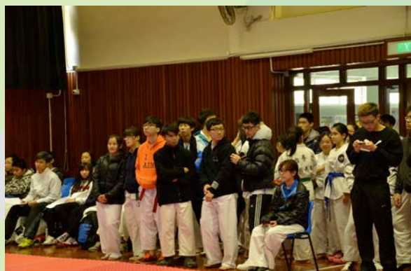
友好跆拳道邀請賽