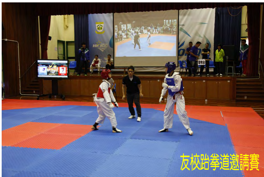
友校跆拳道邀請賽