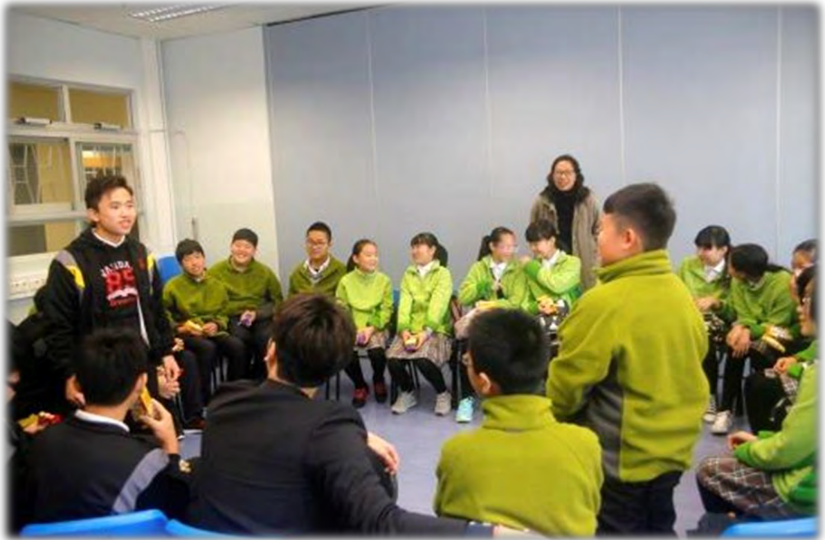
中港學員互動交流