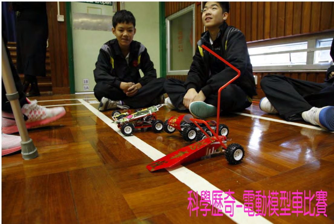
科學歷奇-電動模型車比賽