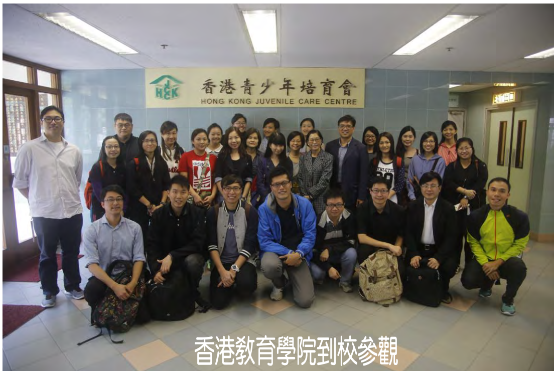
香港教育學院到校參觀