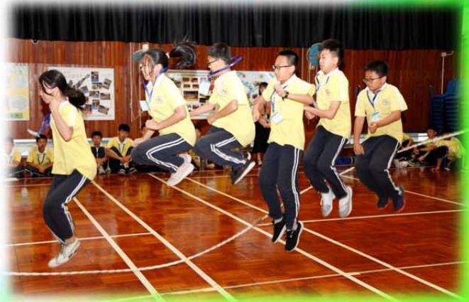
華粵學生投入參賽