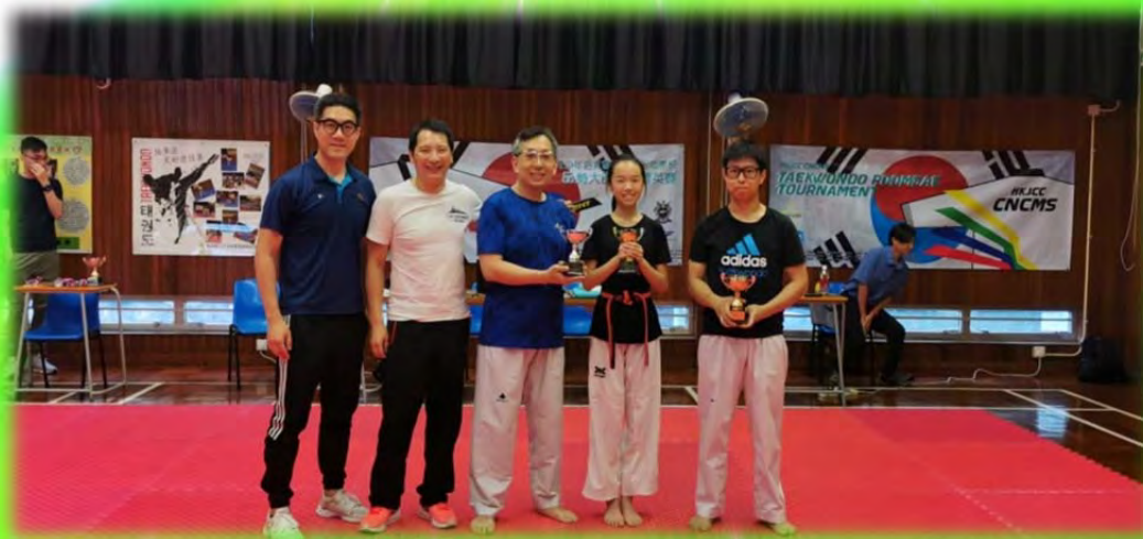
品勢大師盃及菁英賽 2019