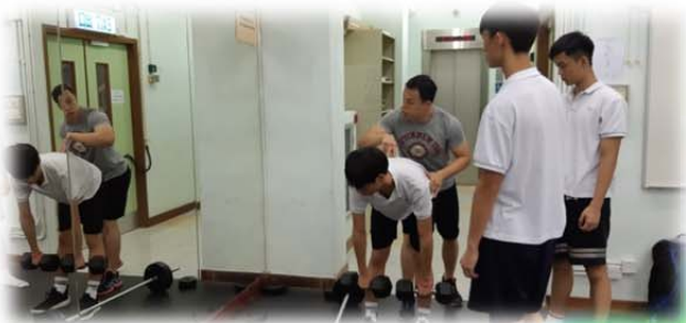
健身 健心 健生