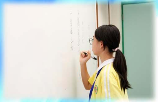
華粵學生參與課堂活動