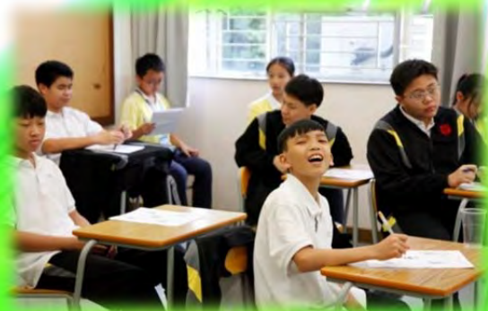
英德同學於 1A 班上中文課