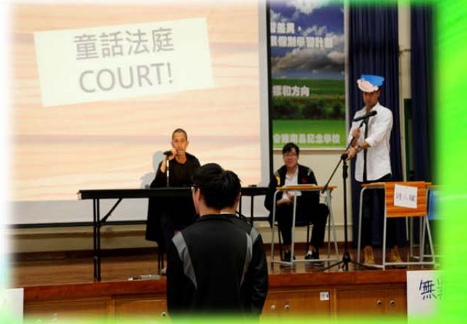
童話法庭 - 判斷對與錯