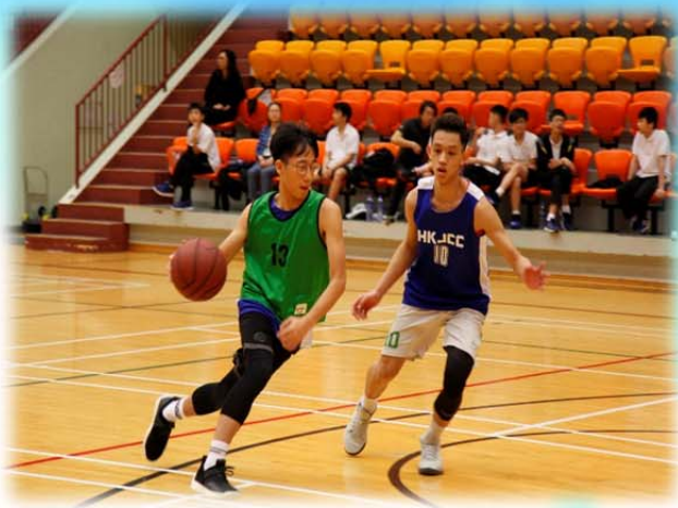
校長盾 - 籃球賽