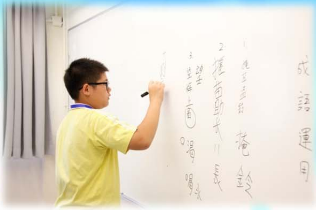
華粵學生於中文課堂板書成語