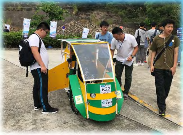
周年活動 - 製作太陽能電動車