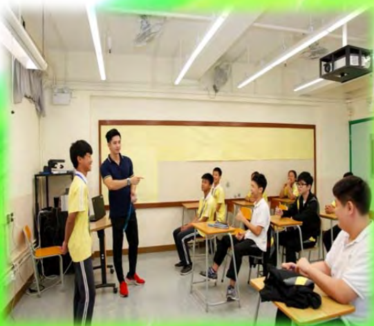
華粵學生掀起學習熱潮