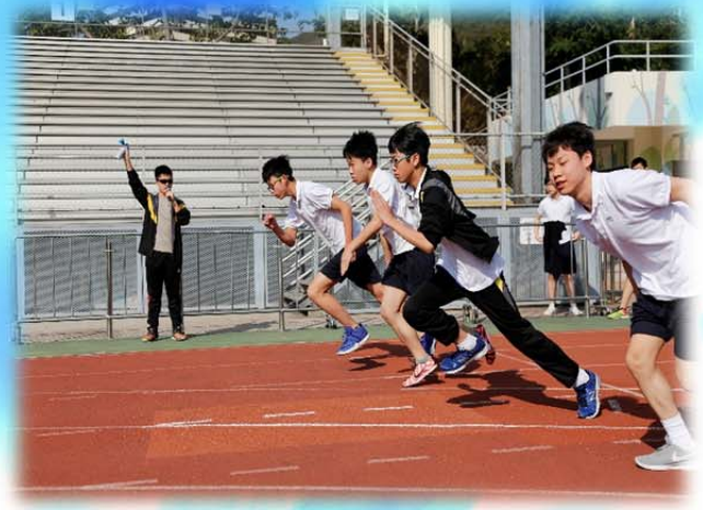
陸運會 - 起跑一剎那