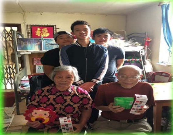
工作體驗 交流人生